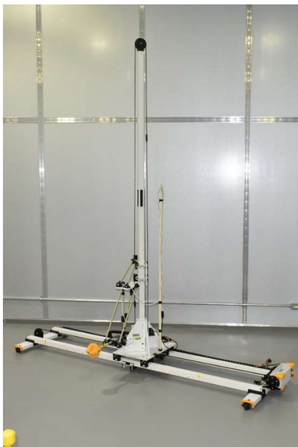
EMF(磁界)スキャナー (EMF: ElectroMagnetic Field)