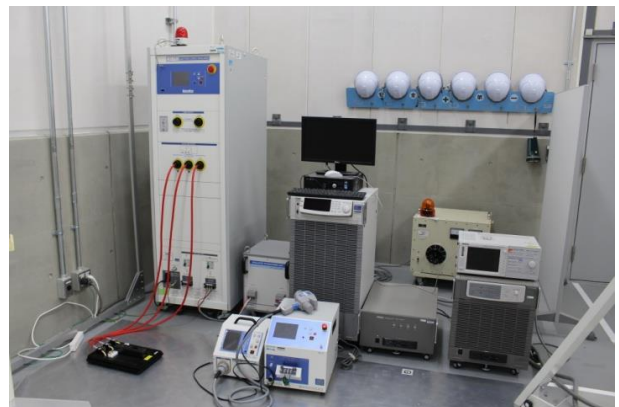
イミュニティ試験機器